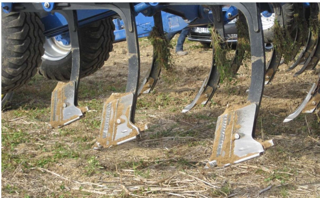
Photo N° 1 : Dents fissuratrices Optimus, dents conventionnelles en arrière plan.

Le profil cultural a été réalisé à l'aide d'un tractopelle jusqu'à un mètre de profondeur environ.