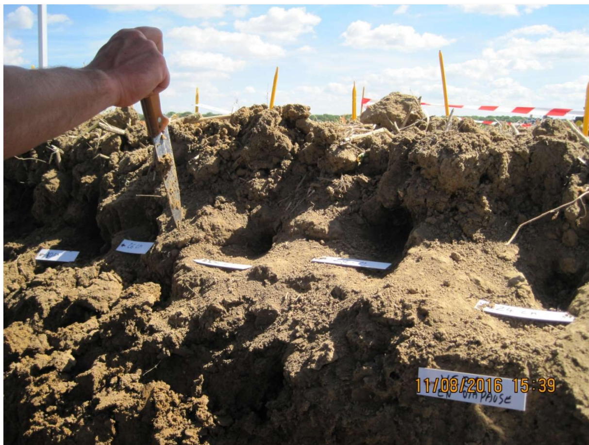
Profil comparatif montrant la différence de profondeur de travail du sol et la présence de mottes déplacées par la dent Betek (à droite du couteau).